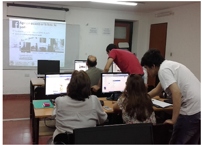
Figura 3. Estudiantes voluntarios ayudando a los alumnos del taller.