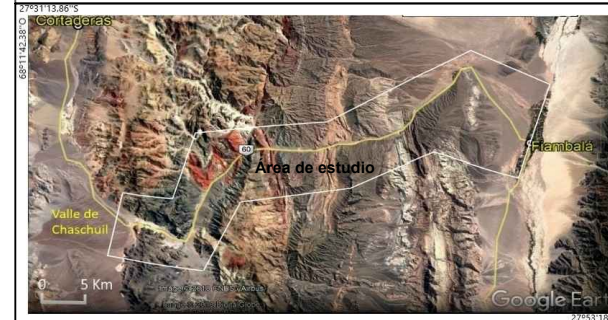
IMAGEN SATELITAL DEL ÁREA

Recomendaciones a los visitantes: El recorrido empieza a una altitud de 1.790 msnm y culmina a los 3.100 msnm en el valle de Chaschuil, forma parte del corredor Bi-oceánico Paso San Francisco. En el sector no hay poblaciones estables, pero si tránsito permanente, por lo que se sugiere revisar el estado del vehículo y no detenerse en las curvas. Al formar parte de un ecosistema frágil y desértico es muy importante no arrojar basura ni dañar los recursos geológicos. Lleva contigo una bolsa para depositar los residuos una vez que llegues a la localidad más cercana. Respeta la flora y fauna. Se sugiere también no realizar los recorridos en días de lluvias.