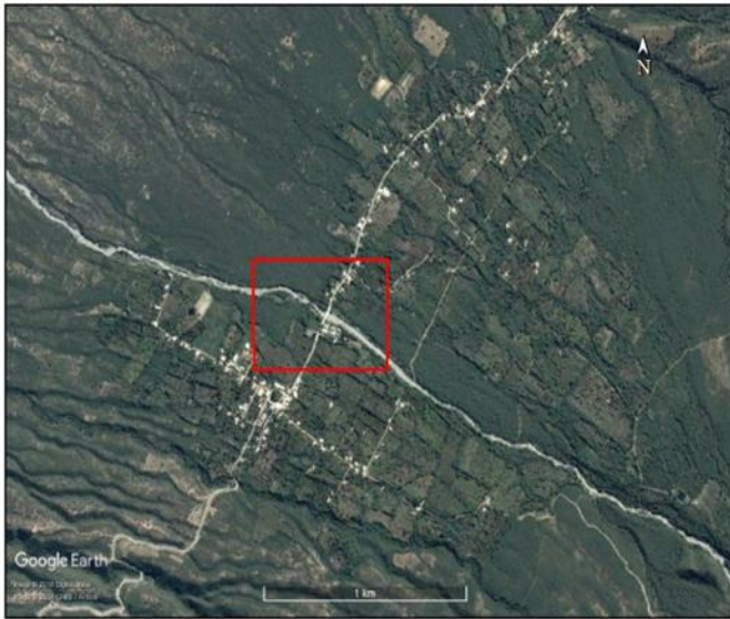
UBICACIÓN DEL ÁREA