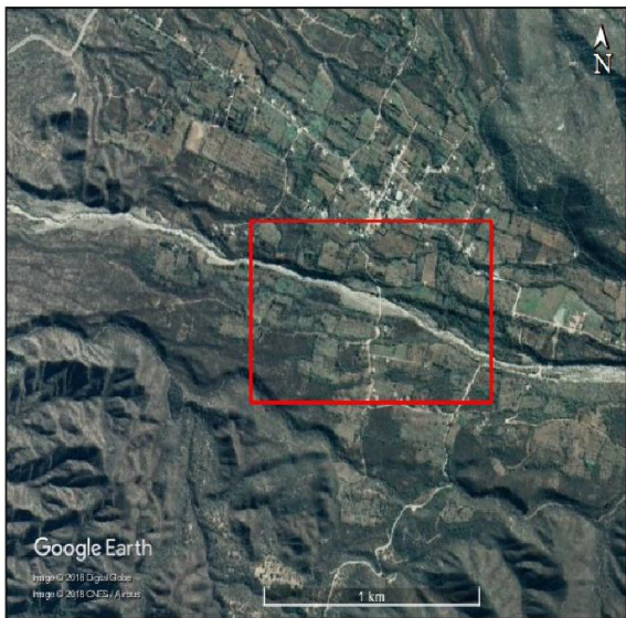
UBICACIÓN DEL ÁREA