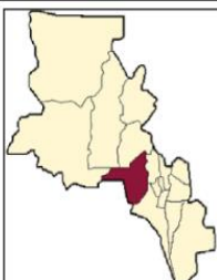
PROVINCIA DE CATAMARCA