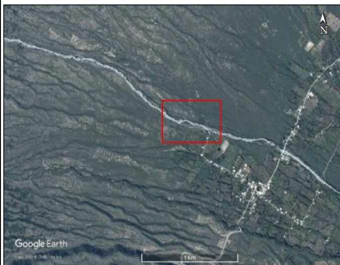
UBICACIÓN DEL ÁREA